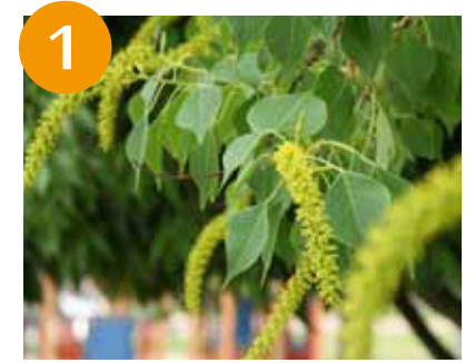
ナンキンハゼ (上旬)