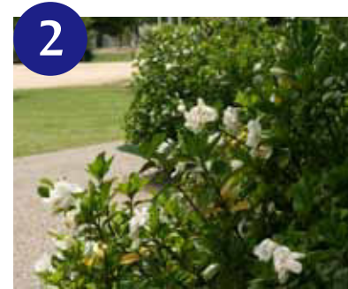
ヤエクチナシ (上~中旬)