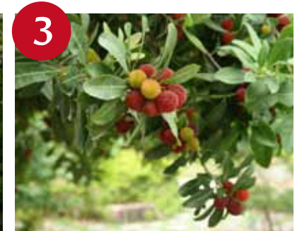
ヤマモモの果実 (上~中旬)