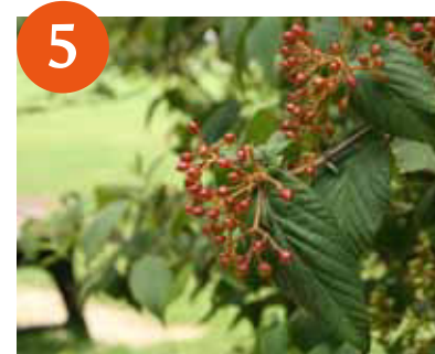
コバノガマズミ果実 (上~下旬)