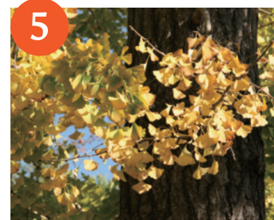
各種紅葉・黄葉（～12月上旬）