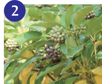
カクレミノの果実（11月上旬～）