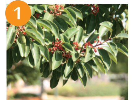
クログネモチの果実（～11月下旬）