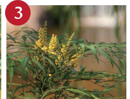
ナリヒラヒイラギナンテン（～11月中旬）