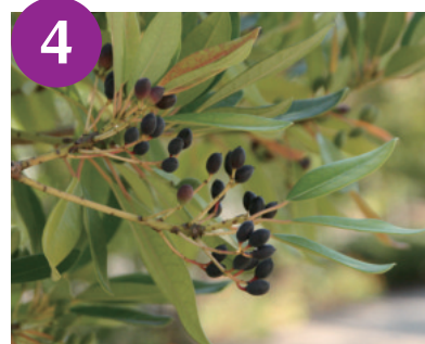
ヒメズリハの果実（～11月下旬）