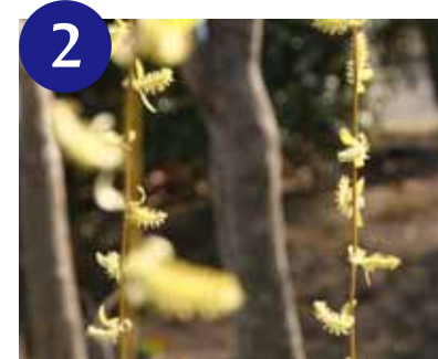
2 シダレヤナギ (3月)