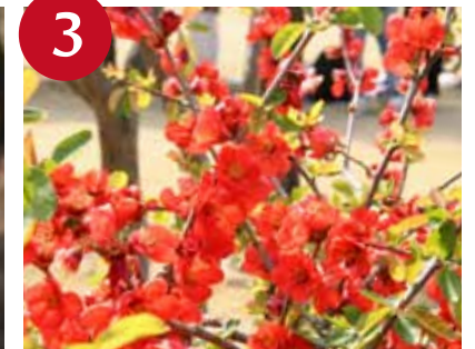
3 ボケ (3月)