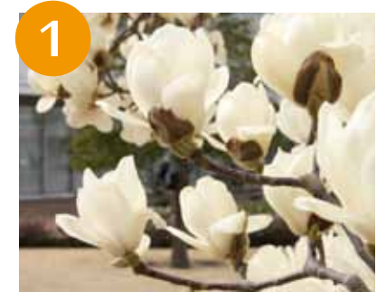
1 ハクモクレンなど (3月中旬～)