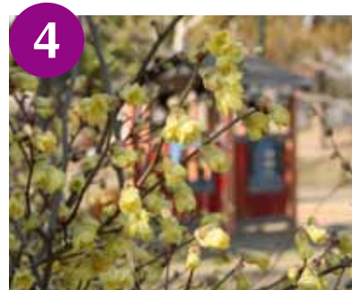
4 ヒュウガミズキ (3月中旬～)