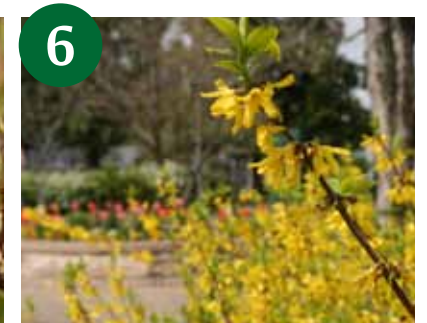
6 シナレンギョウ (3月下旬～)