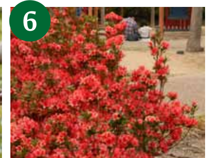
クルメツツジ (4月上旬～)