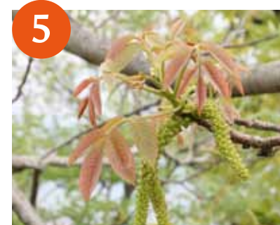
カシグルミ (4月中旬)