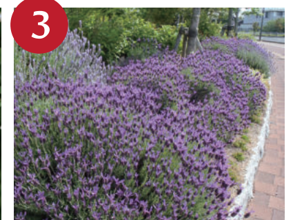
フレンチラベンダー (上～下旬)