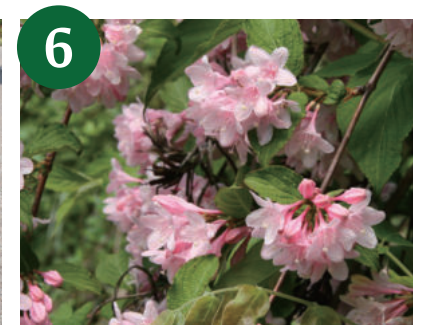
タニウツギ (上～中旬)