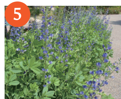
ムラサキセンダイハギ (上～中旬)