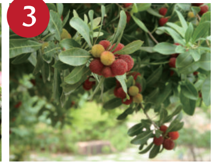
ヤマモモの果実 (上~中旬)