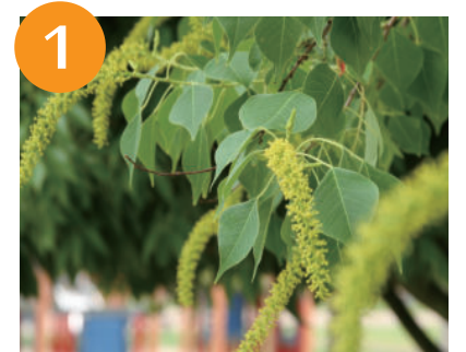
ナンキンハゼ (上旬)