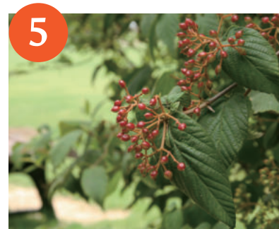
コバノガズミ果実 (上~下旬)