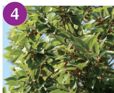
4 エノキの果実 (～9月下旬)