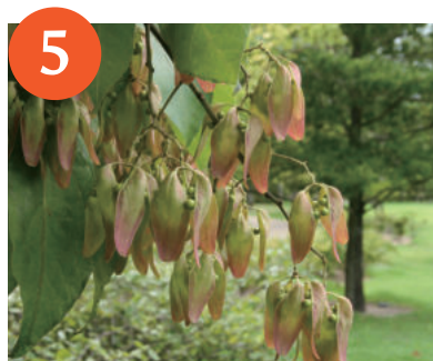
5 アオギリの果実 (～9月下旬)