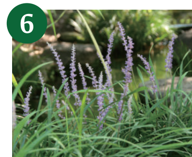
6 ヤブラン (～9月下旬)