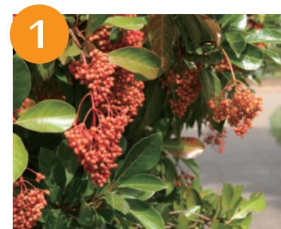
1 サンゴジュの果実 (～9月下旬)