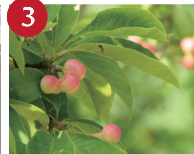
3 コブシの果実 (～10月中旬)