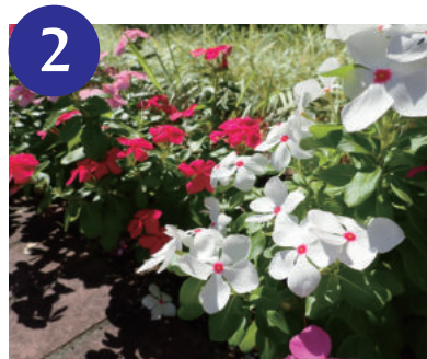
2 ニチニチソウ (～10月)