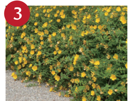
ヒペリカム各種 (上～中旬)