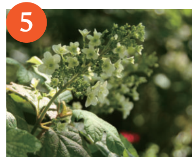
カシワバアジサイ (上～下旬)