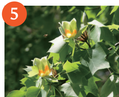
5 ユリノキ (5月上旬～中旬)