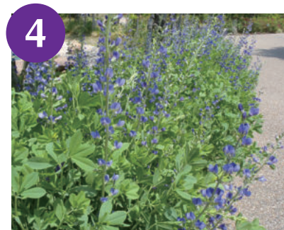
4 ムラサキセンダイハギ (5月中旬～下旬)