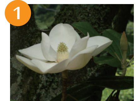
1 タイサンボク (5月中旬～下旬)