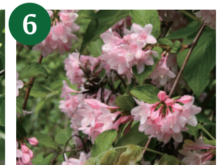
6 タニウツギ (5月上旬～中旬)