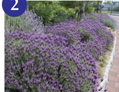
2 フレンチラベンダー (5月上旬～下旬)