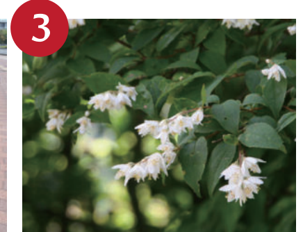
3 ウツギ (5月中旬～下旬)