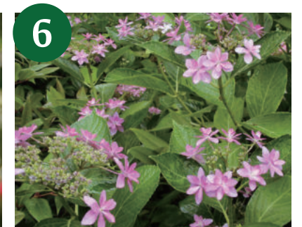
アジサイ各種 (上~下旬)