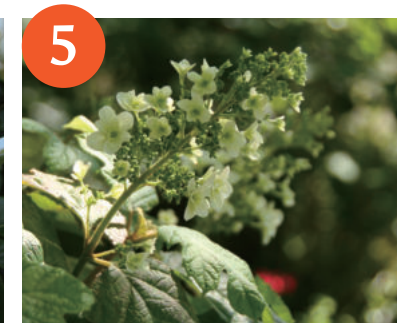
カシワバアジサイ (上~下旬)