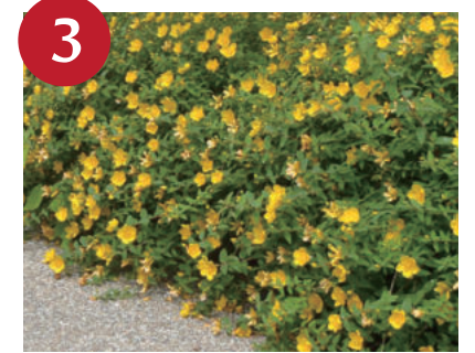
ヒペリカム各種 (上~中旬)